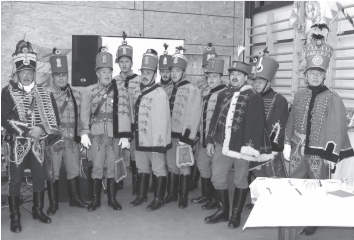
A rögtönzött huszárkórus