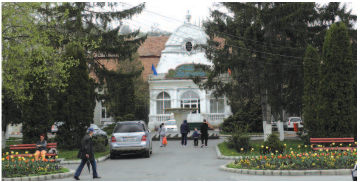
A volt Pekry-kastély

Bár egykor a főtér képéhez tartozott, elejébe tömbházakat építettek, így a Pekry-kastélyal szembeni tömbház alatti bejárón kell átmenni a zsinagógaéhoz, amely a XIX. század végén és a XX. század elején épült mór stílusban. Felirata szerint