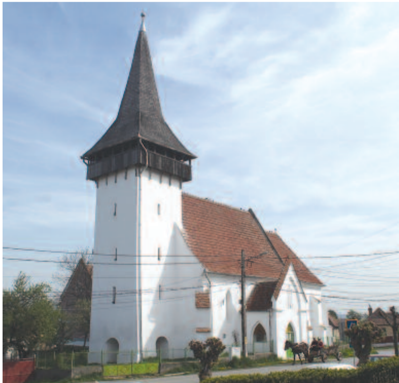
Az ádamosi műemlék templom