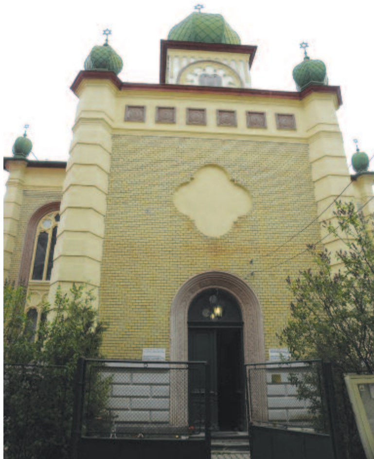
A dicsőszentmártoni zsinagóga

A XV. században említik először, ekkor még Adamus néven. Az unitárius műemlék templom 1518-ban épült, festett kazettás mennyezetét 1526-ban készítették. 1618 és 1695 között tíz zsinat színhelye volt.