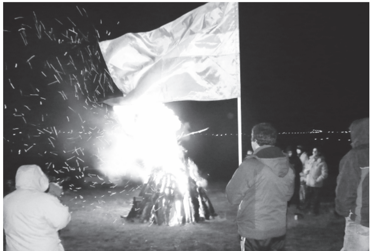
Az erős szél, eső ellenére is több helyen fellobbantak a tüzek

ződve a párbeszéd szükségességéről, és elégedetlenül a román kormány párbeszédet elutasító